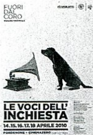
La locandina dell'evento

denti di una cittadina degli Stati Uniti. Un caso esemplare proprio come quello della Dole: sono migliaia i lavoratori che vivono situazioni simili al Nicaragua in altre zone del Sud del mondo come Costa d'Avorio, Panama e Filippine.